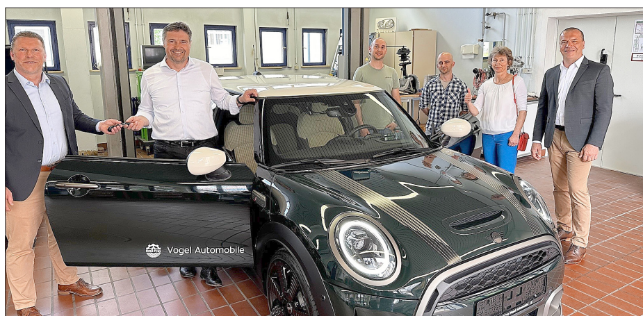
Große Freude über das Auto für eine praxisnahe Ausbildung.