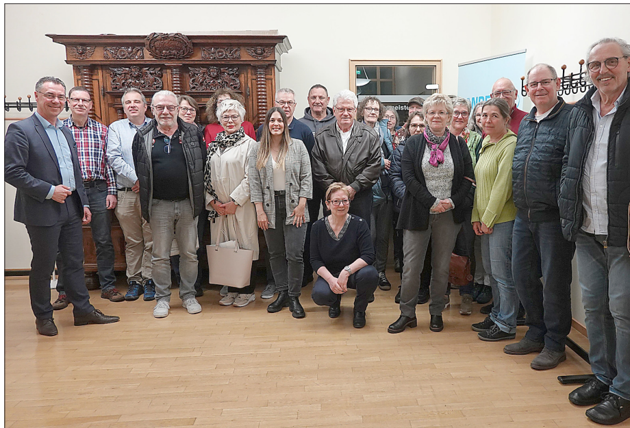
Bei der Zertifikatsübergabe des letzten Einführungskurses.