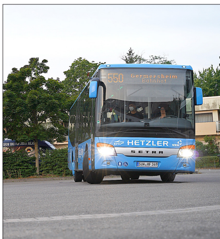
Mehr Fahrten.

Auf der Linie 547 (Bad Bergzabern – Dierbach – Niederotterbach – Kandel) konnte durch eine erhöhte Anzahl an Schülerinnen und Schülern vom sog. „Viehstrich“ durch eine Routenerweiterung eine Direktverbindung von