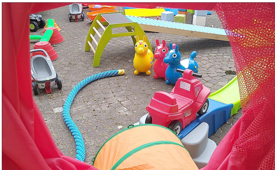
Spielmöglichkeiten für die Kleinsten.

Samstag, 6. Juli in Wörth-Maximiliansau, 11 bis 14 Uhr, Turnerstube 1,