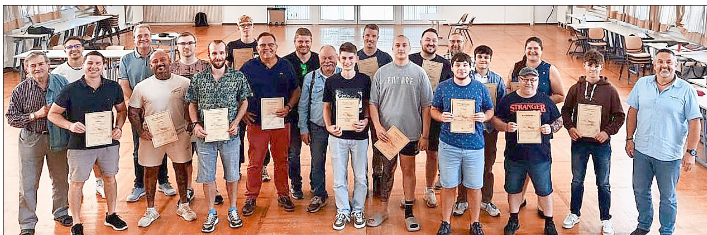
Strahlende Gesichter bei der Übergabe der Fischerprüfungszeugnisse.