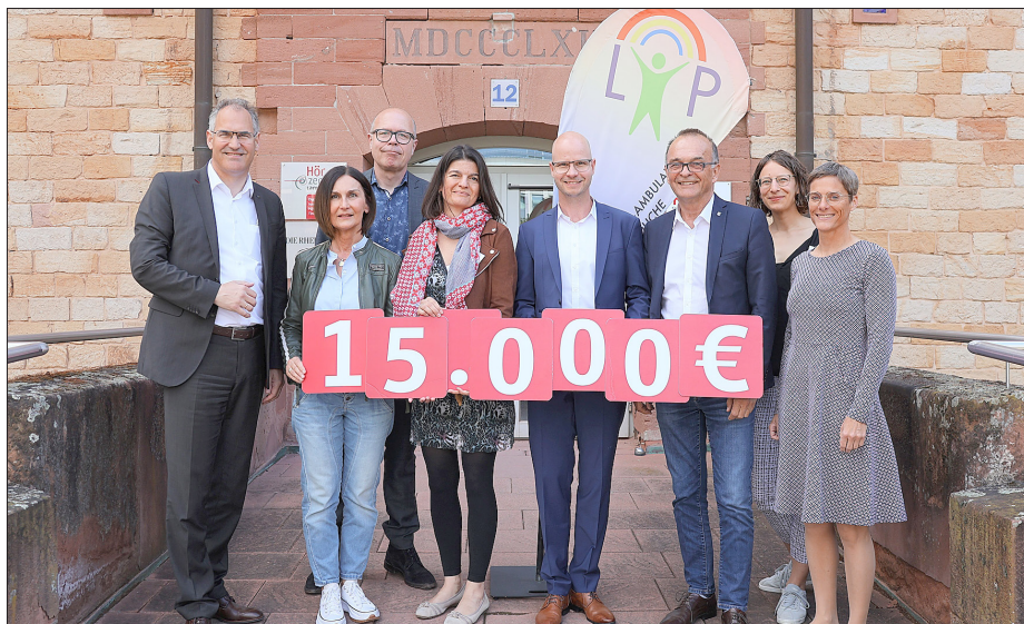
Spende für psychotherapeutische Beratung für Kinder und Jugendliche.